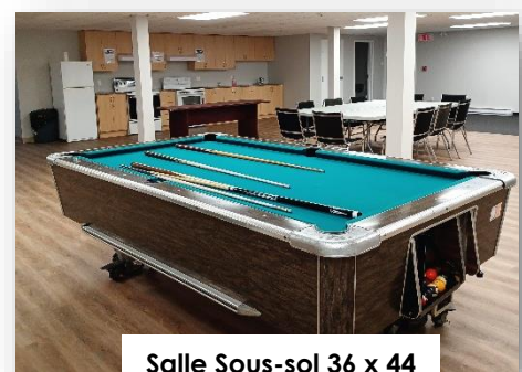
Salle Sous-sol 36 x 44